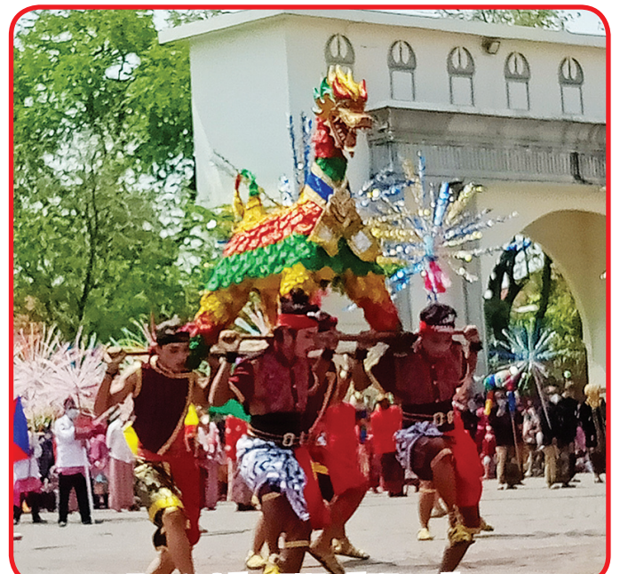
Pertunjukan Warak Ngendog.

SEMARANG (IM) - Pagelaran tradisional Dugderan yang digelar belum lama ini, di Kantor Wali Kota Semarang berlangsung meriah. Meski dikemas secara sederhana, karena masih dalam masa pencegahan pandemi Covid-19.