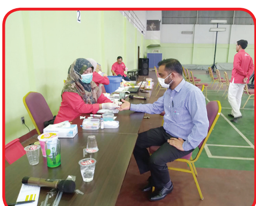
Petugas PMI melakukan tes darah kepada calon pendonor.

Kondisi itu mendorong Karawang International Industrial City (KIIC) untuk menggelar Donor Darah Sukarela yang bertajuk "Setetes Darah Anda Akan Membantu Saudara Kita yang Membutuhkan" di Balai KIIC, Kabupaten Karawang belum lama ini. Kegiatan ini bekerja sama dengan PMI Kabupaten Karawang, diikuti oleh para peserta donor darah dari tenant dan karyawan KIIC.