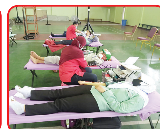
Suasana donor darah di Balai Karawang International Industrial City.

Kami harap kegiatan ini dapat menumbuhkan semangat dan kesadahan dalam diri masyarakat khususnya karyawan perusahaan KIIC akan