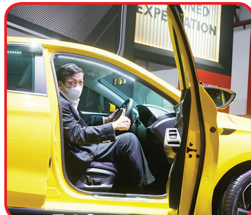
Interior yang nyaman.