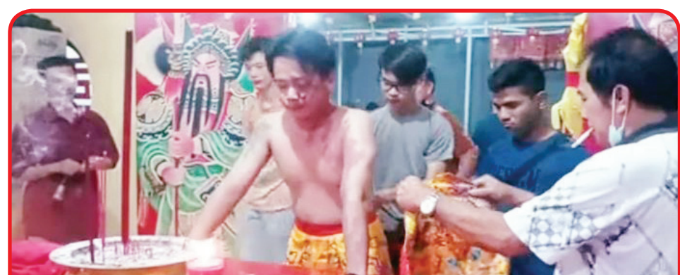
Ketua Kelenteng Wie Lieong Keng Agong bersama tatung menjelang pelaksanaan ritual Ciap Sin.

"Bedanya kalau hari biasa di luar Cheng Beng, kita harus menunggu hari baik untuk berziarah. Cuma kalau hari Cheng Beng kapan saja bisa dilakukan oleh warga Tionghoa," pungkasnya. • idn/din