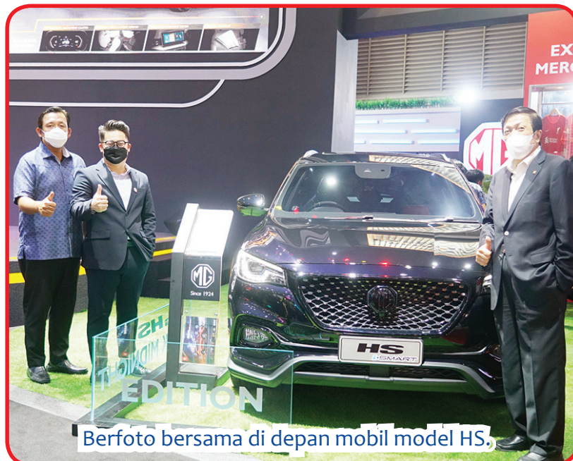
Berfoto bersama di depan mobil model HS.

Shanghai Automotive Group adalah industri otomotif terbesar di Tiongkok. Salah satu dari 5 produsen mobil teratas dunia, menempati peringkat ke-51 dari 500 besar dunia pada tahun 2020, dengan produksi mobil tahunan sebesar 7 juta kendaraan. • jhk/din