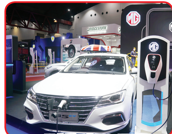
Mobil listrik MG 5 EV.