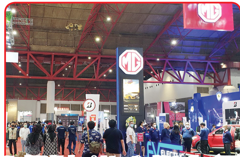
Stand MG di Indonesia International Motor Show (IIMS) 2022.

JAKARTA (IM) - Merek mobil ternama asal Inggris Morris Garage (MG) berpartisipasi dalam "2020 Indonesia International Motor Show (IIMS)" dari 1 hingga 10 April, di JIE XPO Hall A, Kemayoran, Jakarta.