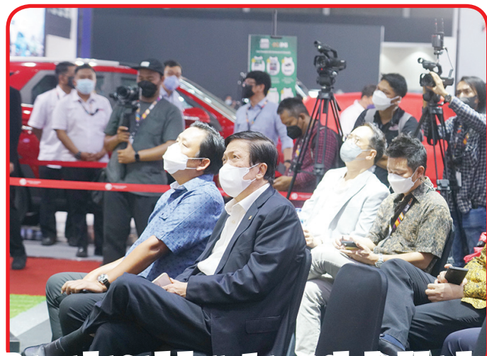
Para undangan kehormatan yang hadir dalam kegiatan presentasi.