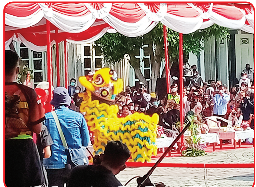
Pertunjukan barongsai yang ditampilkan perwakilan komunitas Tionghoa Semarang turut memeriahkan Dugderan.